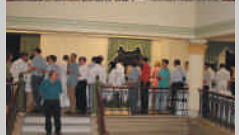
Após a apresentação e discussão dos trabalhos o jantar de confraternização foi servido na Faculdade de Medicina da USP em local restaurado muito agradável.

Após os trabalhos foi oferecido o jantar em área restaurada da FMUSP e em um clima muito agradável todos puderam confraternizar. Próxima reunião científica será no dia 25 de Março.