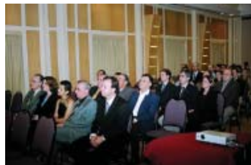
Convidados no Auditório do Hotel Gran Mercure

Acreditamos que a publicação deste livro contribuirá para a atualização dos aspectos mais importantes da doença aterosclerótica periférica.