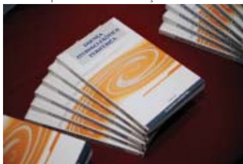
Livro "Doença Aterosclerótica Periférica"