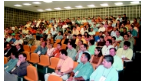
Restaram poucos lugares no Anfiteatro Amarelo de Centro de Convenções Rebouças

Com tanto apoio e incentivo o Módulo III, Tórax e Abdome, já tem data marcada para dia 02 de Outubro de 2004.